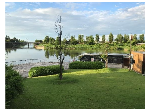
美術館近くにある 世界一美しいスタバでお茶もよし