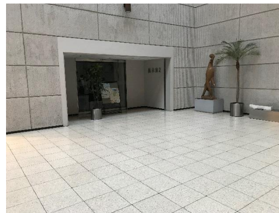
とやま臨床美術展・高周波文化ホール