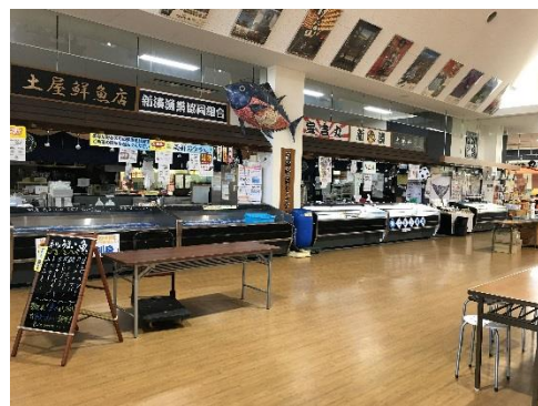
お土産も買えます