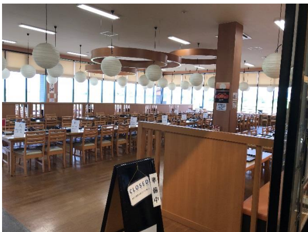
昼食会場 きつときと市場